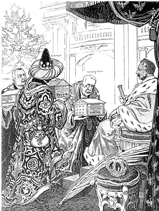
Abb. 4.2: Karikatur der Satirezeitschrift „Simplicissimus“ aus dem Jahre 1912 zur Gründung der Kaiser-Wilhelm-Gesellschaft: „Die drei Könige aus dem Morgenland bringen ihre Weihnachtsgeschenke.“

Preußische Gesellschaft firmieren sollte, auf einer breiten Mitgliederbasis vorgeschlagen. Die Einbeziehung auch weniger vermögender Personen sollte durch einen niedrigen Mitgliedsbeitrag von 50 bis 100 Mark ermöglicht werden. Ein derartig organisierter Förderverein hätte das Projekt auf eine wesentlich breitere soziale Basis gestellt und damit auch zu einer tieferen Integration der Kaiser-Wilhelm-Gesellschaft in die Bürgergesellschaft geführt. Unter den Organisatoren fand Rathenaus Vorschlag jedoch keine Mehrheit. Damit war das Projekt der Kaiser-Wilhelm-Gesellschaft von Anfang an als ein exklusiver Millionärsklub angelegt. 41