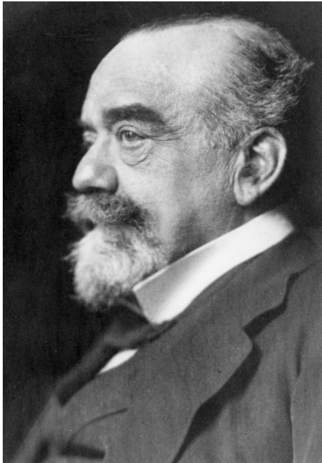
Abb. 4.1: Robert von Mendelsohn

liegenden Arbeiten zur privaten Wissenschaftsförderung wäre es auch von Vorteil, wenn die künftige Erforschung der privaten Förderung von Bildung und Forschung im Kontext der Forschungen zum Stiftungswesen beziehungsweise dem Dritten Sektor und nicht länger in Isolation von diesem neuen interdisziplinären Forschungsfeld erfolgten. Nur so lassen sich vorschnelle Schlussfolgerungen über die Singularität bestimmter Stiftungsprojekte vermeiden und Zusammenhänge zwischen dem Engagement von Stiftern in sozialen, kulturellen und wissenschaftlichen Tätigkeitsfeldern herausstellen.